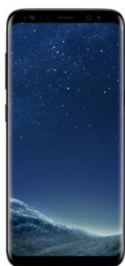
Samsung Galaxy S8 64 GB Standard-Preis: 83,95€ 15

Das exklusive Produktivitätspaket mit der aktuellen Samsung Galaxy S8-Serie zum Top-Preis