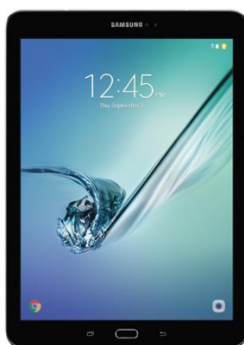
Samsung Galaxy Tab S2 9.7 32 GB Standard-Preis: 520,92€ 15