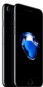
iPhone 7 32 GB Standard-Preis: 41,93€ 15

Unsere alternativen Angebote mit dem Red Business+ Kombi-Vorteil und der Vodafone 4G|LTE-UltraCard