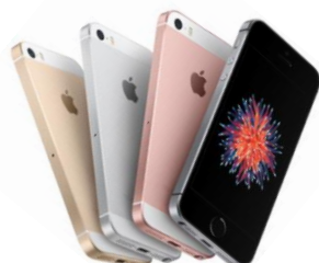
iPhone SE 32 GB Standard-Preis: 8,32€ 15