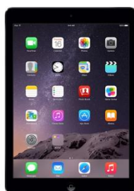
iPad 32 GB Standard-Preis: 470,50€ 15