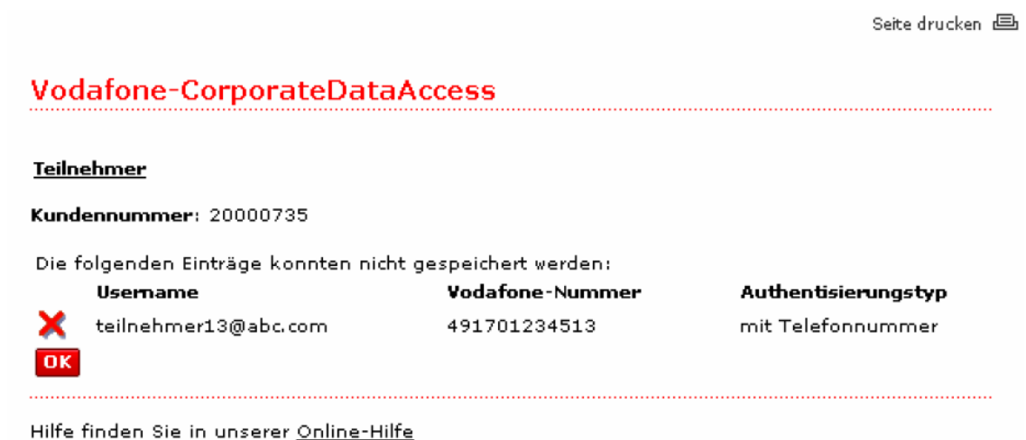
Abbildung 4: Fehlermeldung beim speichern von Daten

Sollte die Speicherung eines Eintrags im System scheitern wird dieser durch ein „X“ angezeigt. Bitte wiederholen Sie die Eingabe solcher Einträge.