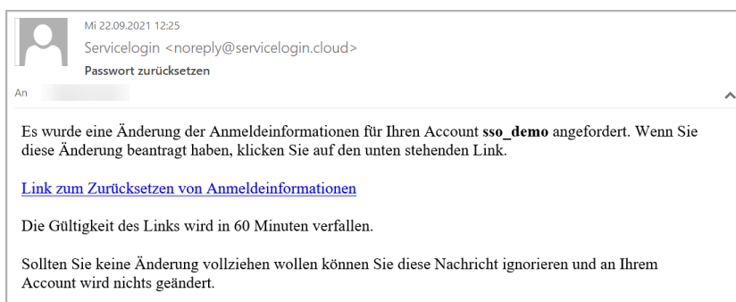
Benachrichtigungs-E-Mail mit Link zum Servicelogin

Alle Benutzer erhalten ihren Link zum Servicelogin per E-Mail an die für sie hinterlegte E-Mail-Adresse.