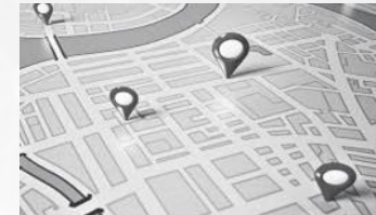
Keine Information über die Fahrzeugposition