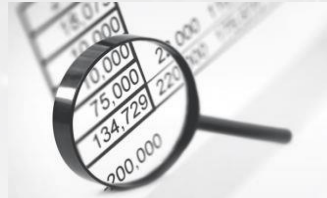
Keine bis geringe Kostentransparenz

Das Management von Fahrzeugen kostet Zeit und Geld